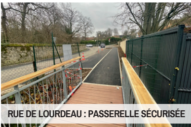
RUE DE LOURDEAU : PASSERELLE SÉCURISÉE

Réalisation d'une passerelle sécurisée pour protéger l'accès des piétons et création de places de stationnement