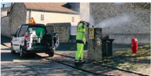
2020 - NETTOYAGE DU MOBILIER URBAIN

Dès l'installation de la nouvelle équipe municipale, un plan de restauration des infrastructures et du mobilier urbain a été lancé afin de les embellir. Cela s'est traduit par la peinture des bâtiments (Salle des fêtes, l'école Charles Perrault, porte de l'Église, lampadaires, etc.), ainsi que le nettoyage haute pression d'autres bâtiments communaux.