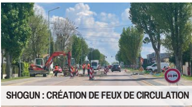
SHOGUN : CRÉATION DE FEUX DE CIRCULATION

Comme nous le rappelions dans l'édition précédente, la loi relative à la solidarité et au renouvellement urbain (SRU) a été relevée à 25% de logements sociaux, avec une suppression de la date butoir de fin 2022 pour atteindre le taux légal. Bien que les élus de Pringy défendent systématiquement la position communale qui vise à éviter l'asphyxie de nos infrastructures (écoles, routes, réseaux, etc.), il faut agir pour que les projets livrés s'intègrent le mieux possible aux réseaux routiers. C'est pour cette raison que le Maire de Pringy a fait modifier l'accès à la nouvelle résidence sur le site dit « shogun », initiée en 2019, pour que des feux de circulation puissent être installés pour la sécurité des piétons et des usagers de la route. Les fondations ont été réalisées et l'aménagement sera livré à la rentrée de septembre 2023.