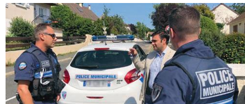
2021 - PROFESSIONNALISATION DE LA POLICE MUNICIPALE DE PRINGY

Parmi les mesures lancées rapidement après la mise en place du nouveau Conseil municipal, celles concernant le cimetière ont été initiées très rapidement afin de donner un nouveau visage à ce haut lieu de recueillement permettant d'honorer la mémoire des défunts des familles pringiaciennes.