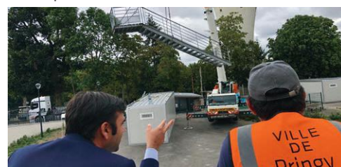
2021 - SUM DU CHANTIER DE L'ÉCOLE

Afin de mettre fin aux comportements dangereux auxquels les riverains et les piétons étaient confrontés rue de l'Église, la Municipalité a décidé d'installer un dispositif pour ralentir les véhicules en les empêchant de rouler sur le trottoir à vive allure.