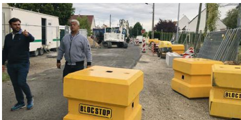
2020 - SÉCURISATION DU STADE

La Mairie et la Salle des Fêtes ont été mises en accessibilité extérieure pour permettre aux personnes à mobilité réduite de pouvoir accéder facilement aux bâtiments communaux.