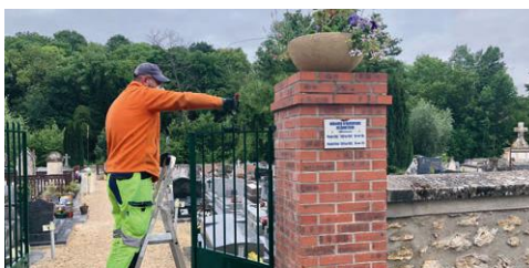
2020 - PLAN D'ACTIONS POUR LE CIMETIÈRE

L'amélioration du cadre de vie passe également par la création d'événements permettant de partager des moments conviviaux au cœur de la commune. Les Nocturnes Estivales ont, à ce titre, inauguré cette volonté de vous proposer des temps forts rythmant l'année. Depuis, que ce soit pour la Pringy Party au printemps, la fête de la Citrouille à l'automne ou la fête patronale et ses concerts à la rentrée, la culture et l'art se réunissent pour vous proposer de beaux instants d'évasion en famille ou entre amis, dans le cadre préservé et singulier de l'esprit de village de notre commune.