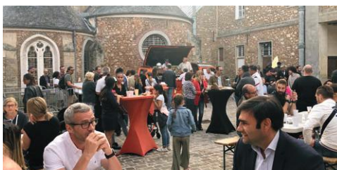
2020 - CRÉATION DES NOCTURNES ESTIVALES

Cela faisait plusieurs années que le stade communal de Pringy était victime d'installations illégales pour être transformé en aire d'accueil où étaient regroupées des caravanes. Après une tentative déjouée le 24 juillet 2020, grâce à la réactivité de l'équipe communale et à l'intervention rapide des forces de l'ordre, une sécurisation a été lancée en urgence. Depuis, le stade est sécurisé, les associations sportives peuvent l'utiliser et la collectivité n'a plus à payer les 15 000 euros de remise en état qu'elle avait dû déboursier lors des trois dernières occupations.