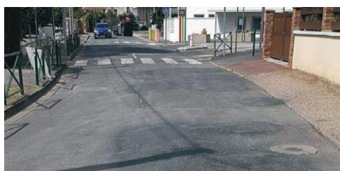
2020 - PLAN DE RÉNOVATION DE LA CHAUSSÉE

Les services techniques ont été équipés d'un laveur haute pression pour optimiser leur temps de travail et nettoyer efficacement le mobilier urbain. Cet équipement redonne vie aux pierres et matériaux de nos infrastructures en ravivant leurs couleurs.