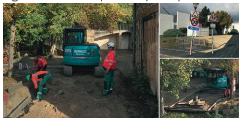
2020 - CRÉATION DE PLACES DE PARKING PMR

Des moyens ont été alloués pour traiter en urgence les portions de route fortement dégradées pour diverses raisons : passage quotidien des poids lourds, des bus, coût des réfections, etc. Depuis, des campagnes de rebouchage sont programmées régulièrement sur les points les plus exposés.