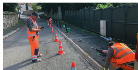
2021 - SÉCURISATION DE LA RUE DE L'ÉGLISE

Conformément aux objectifs fixés par le Maire de Pringy et aux engagements pris par le Conseil municipal pour renforcer la tranquillité publique, assurer la sécurité de proximité et protéger notre cadre de vie, la Police municipale de Pringy a été renforcée. Un chef de Police municipale, qui a officié en Police nationale et en Gendarmerie, a été recruté pour encadrer les effectifs expérimentés qui sont déployés six jours sur sept, avec de nouveaux horaires et une présence le samedi.