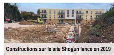
Constructions sur le site Shogun lancé en 2019

Lors d'échanges avec les habitants, la thématique des constructions revient de façon récurrente, avec souvent des confusions et une impression que la Commune lance toujours plus de projets de construction sans prendre en considération les infrastructures saturées. Bien au contraire, l'équipe municipale est extrêmement vigilante et veille à un développement raisonné qui ne se fasse pas au détriment de la qualité de vie des habitants tout en respectant les objectifs fixés par la loi. Actuellement, il y a deux chantiers en cours, celui sur le site dit « Shogun » lancé en 2019 avec 112 logements, et un deuxième, entre Lidl et la Pharmacie des Écoles, dont le projet initial de début 2020 a été drastiquement revu à la baisse par la nouvelle équipe municipale.