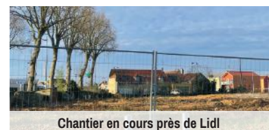
Chantier en cours près de Lidl